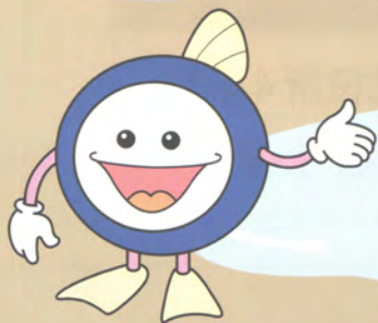
下水道マスコットキャラクター 「スイスイ」